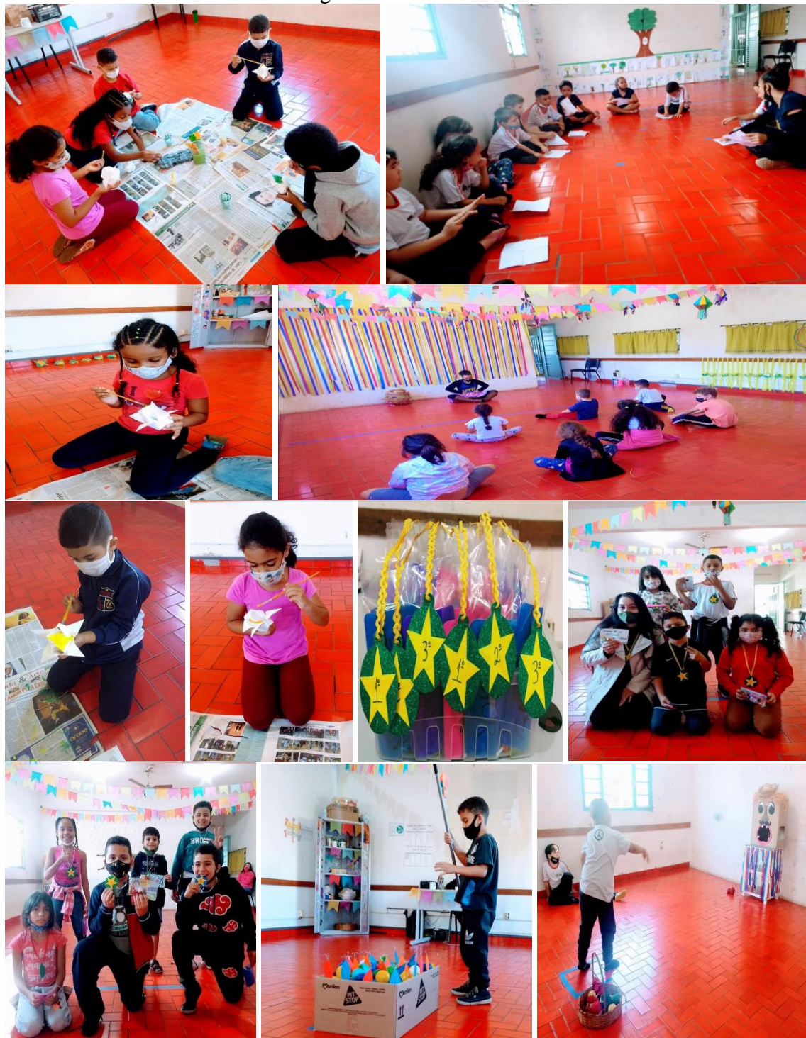
Registros das atividades:

De maneira contextualizada as atividades trouxeram significado ao aprendizado adquirido, estimulando a participação, promovendo o desenvolvimento e o trabalho em conjunto, além da estrutura corporal e motora, socializando os educandos com as diversas atividades lúdicas e culturais com temática junina.