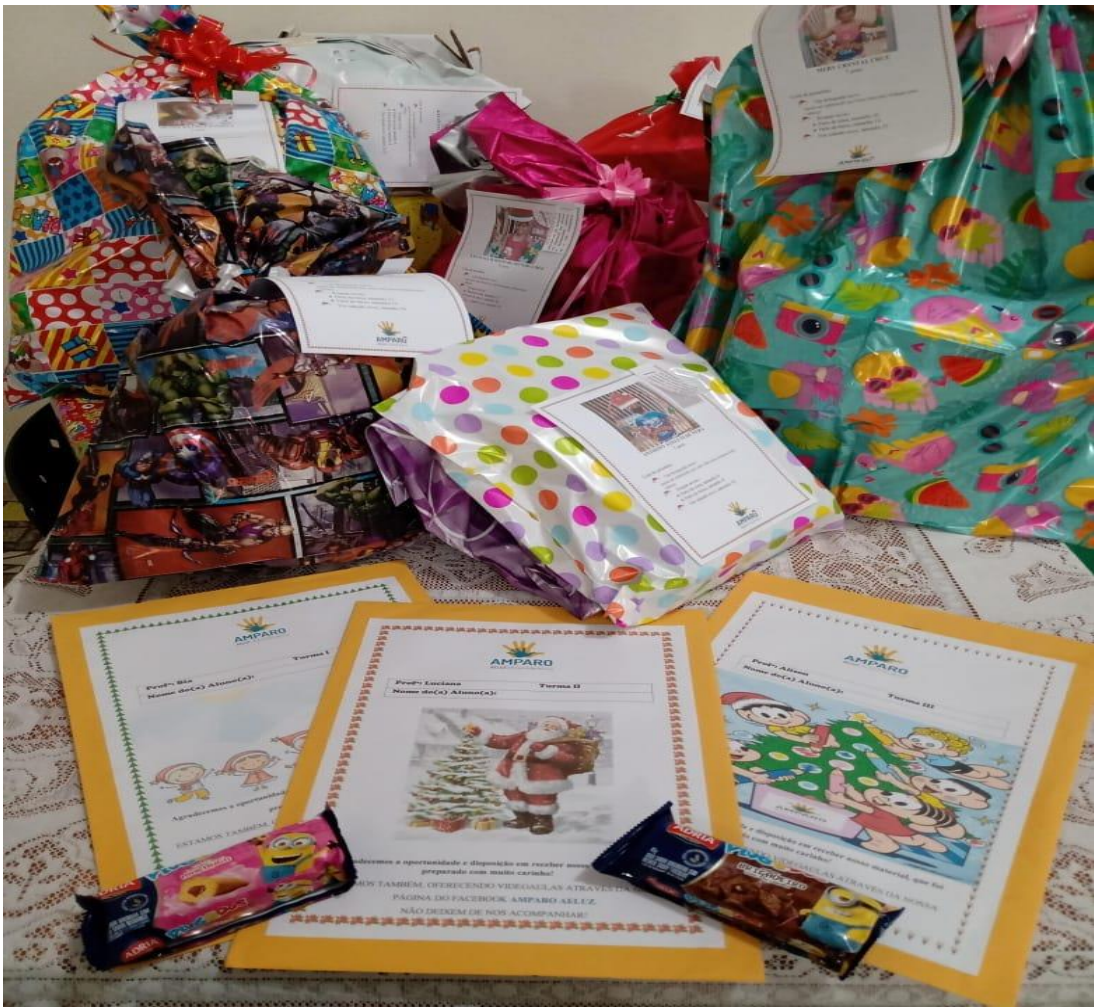
Alguns registros das entregas de atividades e presentes aos alunos.