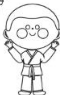
7 - ROXA