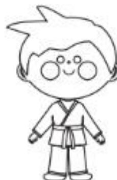
11 - VERMELHA