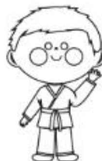
8 - MARROM