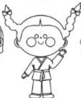
6 - VERDE