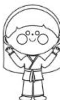
4 - AMARELA