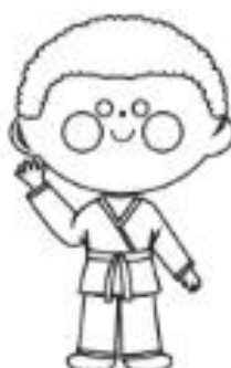
3 - AZUL