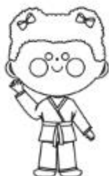
9 - PRETA