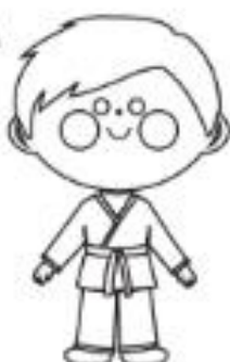
2 - CINZA