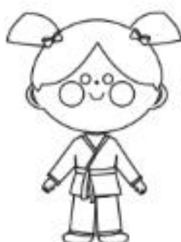
1 - BRANCA

PINTE CORRETAMENTE AS FAIXAS NAS CORES DE ACORDO COM A ORDEM DA GRADUAÇÃO!