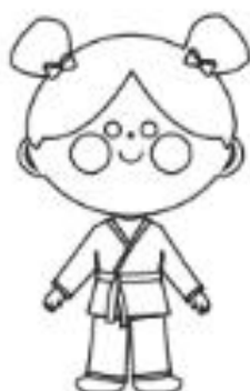
10 - VERMELHA E BRANCA