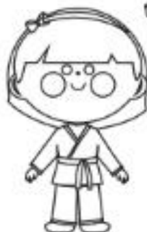
5 - LARANJA