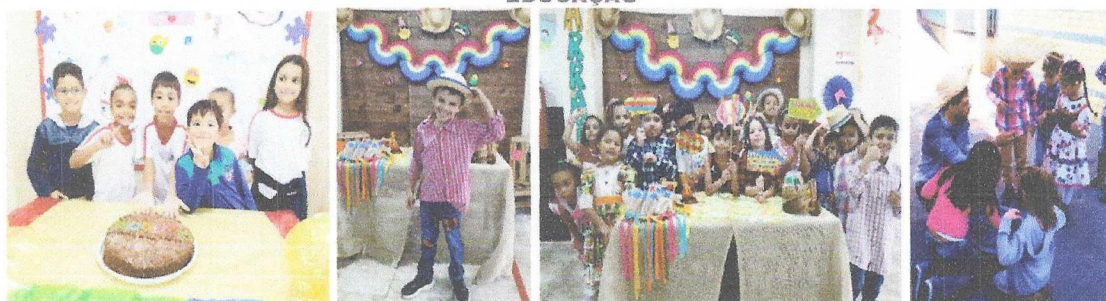
Julho: Colônia de Férias