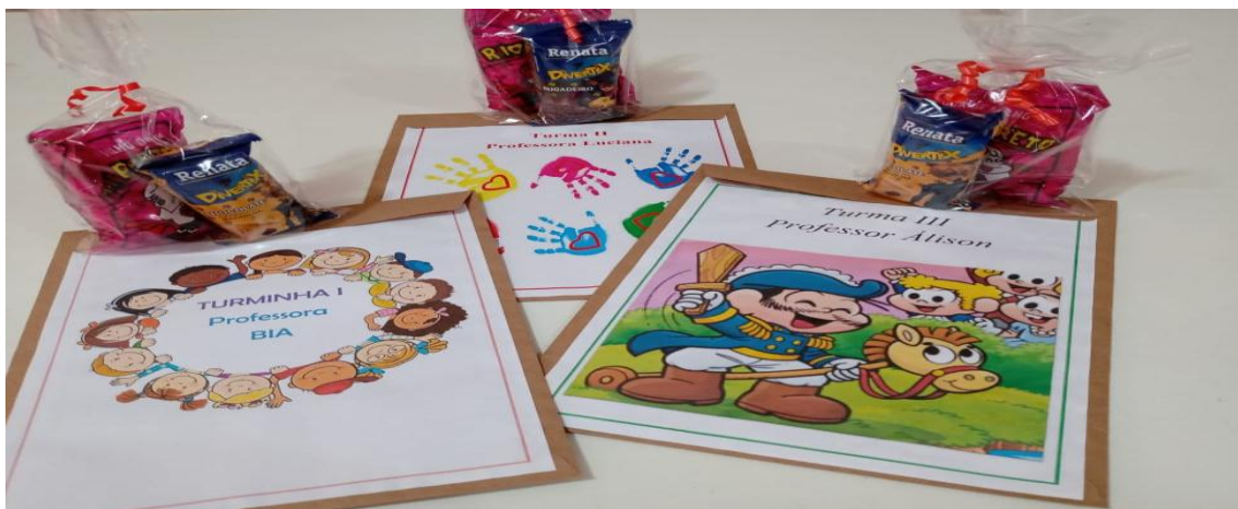
Kit Pedagógico/Atividades Impressas – 10/2020