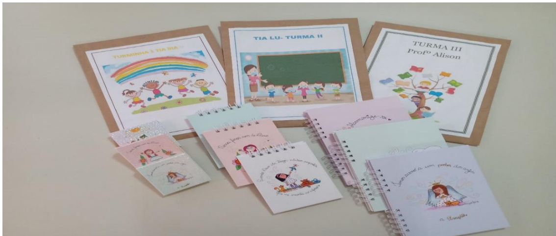
Kit Pedagógico/Atividades Impressas – 09/2020