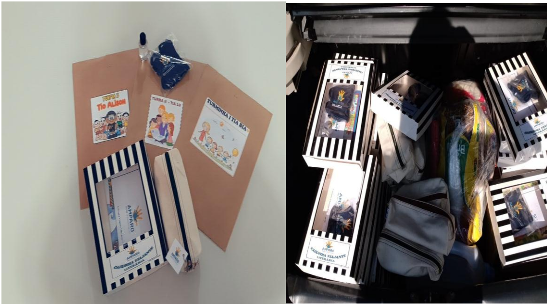
Kit Pedagógico/Atividades Impressas – 06/2020